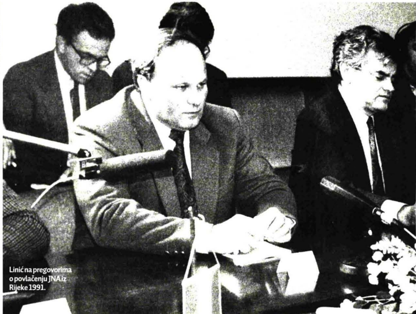
Linić na pregovorima o povlačenju JNA iz Rijeke 1991.