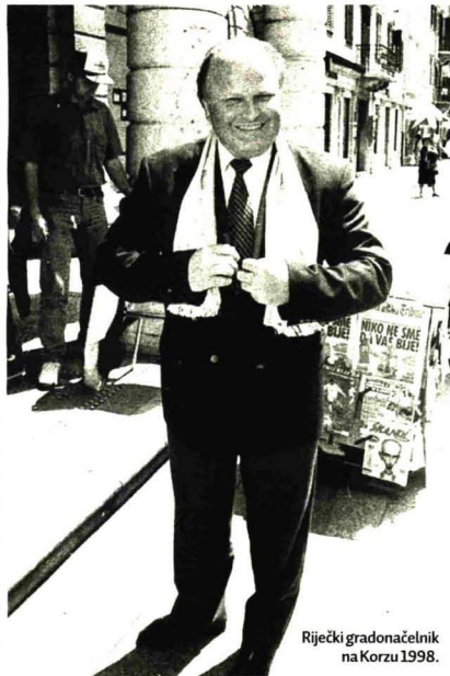
Riječki gradonačelnik na Korzu 1998.

- To nije istina. Poslovni sektor vršio je jak pritisak, ali mi smo se odupriješili. I kao što sam već rekao, jasno smo poručili da će sve što ide prema osobnoj potrošnji biti dodatno oporezovano. Zamjeraju vam što ste se odlučili na tu mjeru jer